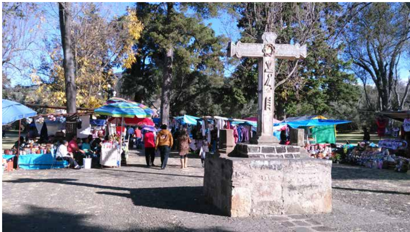
Figura 13. Comercio informal en el atrio del Ex convento de Tzintzuntzan. Fotografía de C. Barrera, marzo de 2017.