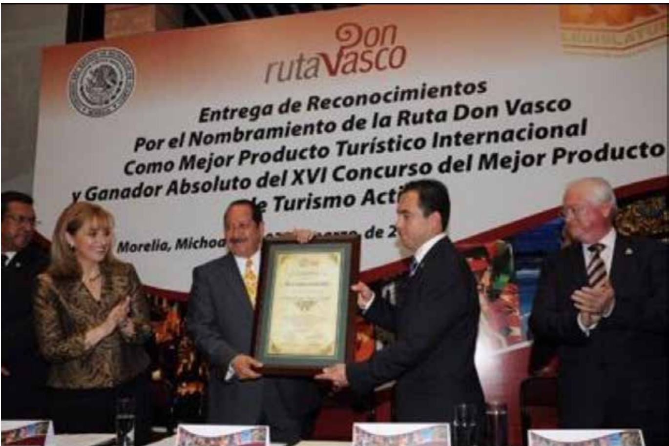
Figura 5. Ceremonia de entrega de Reconocimientos por el nombramiento de la RDV como mejor producto turístico internacional y ganador del XVI Concurso al Mejor Producto de Turismo Activo.