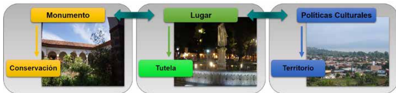
Figura 1. Evolución de conceptos de las categorías patrimoniales.

Identificar metodológicamente algunos de los problemas subyacentes y delinear estrategias de gestión integrales para enfrentar las principales debilidades, puede contribuir para reactivar este programa estratégico. La RDV se considera como “un producto turístico con alto contenido social, que puede generar oportunidades de empleo y desarrollo en comunidades ancestralmente marginadas, contribuyendo a la vez a la dotación y mejora de los servicios públicos”. (SECTUR Michoacán, 2015, p. 53).