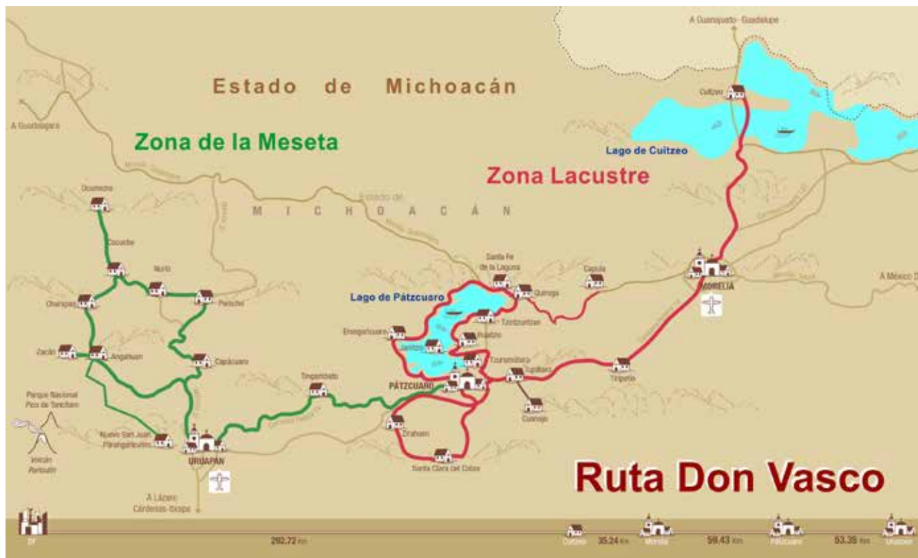
Figura 6. Delimitación territorial del Área del Lago y Meseta Purépecha en la Ruta Don Vasco.

herencia inmaterial de la humanidad: La Noche de Muertos, La Cocina Tradicional Michoacana y el Canto Tradicional de la Pirekua. Además, las poblaciones históricas, la arquitectura vernácula y las zonas arqueológicas hacen un excepcional paisaje cultural y natural, que se estructura principalmente en la Riviera del Pátzcuaro.