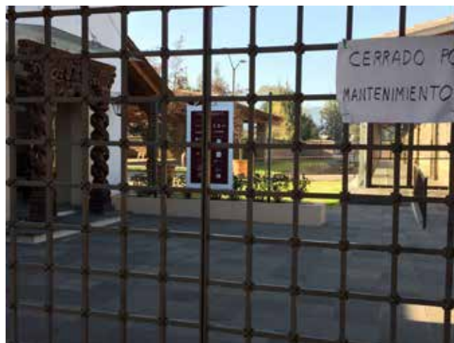
Figura 14. Centro de Interpretación de la Ruta Don Vasco en Pátzcuaro, cerrado formalmente al público en diciembre de 2016. Fotografía de Carlos Hiriart, 2016.

La situación que predominó durante seis años en el sistema de integración y funcionamiento territorial de la RDV muestra una política de gestión turística y patrimonial poco sostenible. Está más orientada a cosificar el patrimonio cultural en los diferentes trayectos, que en atender y mitigar los impactos que se han intensificado; tales como: la especulación urbana, el cambio de uso del suelo para actividades terciarias, la pérdida de la función residencial en las localidades, la subutilización de los recursos económicos, el deterioro gradual del patrimonio construido y urbano en las zonas turísticas, y la apropiación del espacio público