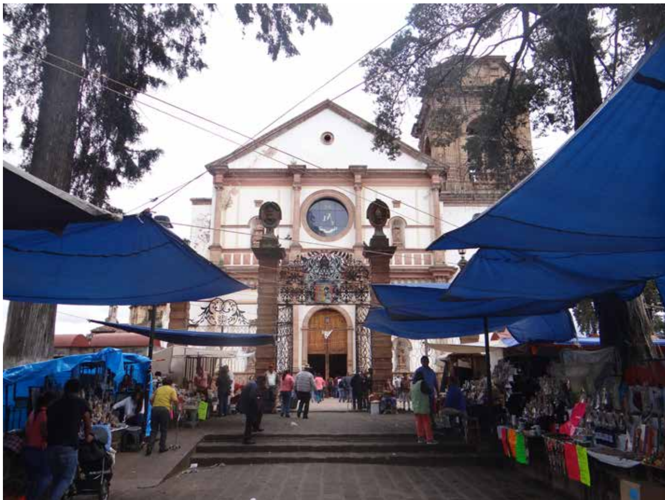
Figura 12. Comercio informal en la entrada de la Basílica de la Virgen de la Salud en Pátzcuaro, Michoacán.

las poblaciones con sus monumentos emblemáticos de carácter religioso (conventos, capillas, templos, plazas, espacios públicos etc.); sin embargo, este patrimonio arquitectónico no está adaptado adecuadamente para atender a los visitantes y las necesidades de los usuarios locales.