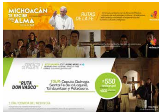
Figura 15. Promocional de la Ruta Don Vasco, como parte de la campaña turística llamada “Rutas de la Fe” con motivo de la visita papal (febrero, 2016).

Los desafíos más importantes en el funcionamiento de la Ruta Don Vasco son: primero, reconocer y gestionar la Ruta como un Patrimonio Cultural Territorial (PCT) que se constituye como un sistema turístico y se justifica plenamente por sus características y valores excepcionales; segundo, establecer el compromiso de todas las autoridades locales involucradas para impulsar y desarrollar y