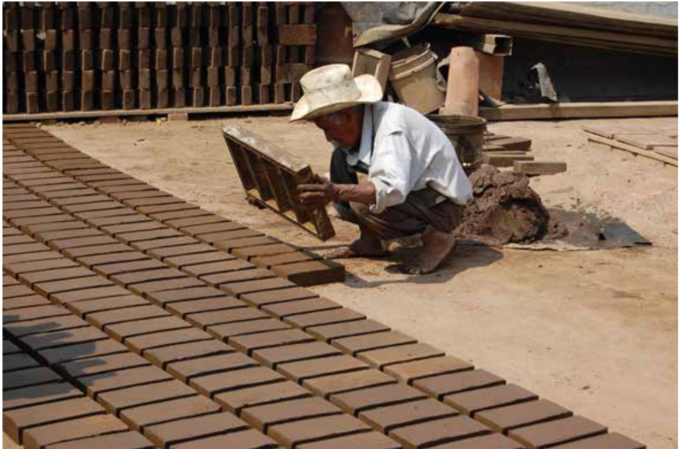
Figura 3. Fabricando ladrillos en la ladrillera Francisco Socoy.