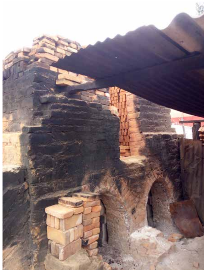
Figura 5. Horno de la ladrillera de Cipriano Oj.

Una vez moldeadas las piezas, éstas se dejan secar, blanquear. El tiempo de secado depende de la estación. En época de lluvia, el proceso resulta más lento. Parte de las piezas se secan a cubierto en la galera, mientras otras quedan a la intemperie para aprovechar los momentos de sol, siendo cubiertas cuando llega la lluvia. Cuando el material ya está seco, entonces se amontona todo en la galera para proceder a cargar el horno.