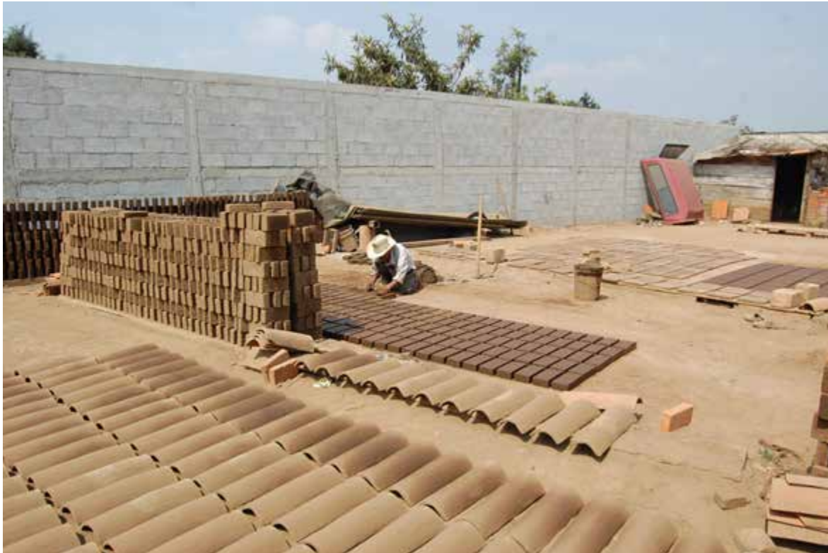
Figura 1. Patio de la ladrillera de Francisco Socoy.