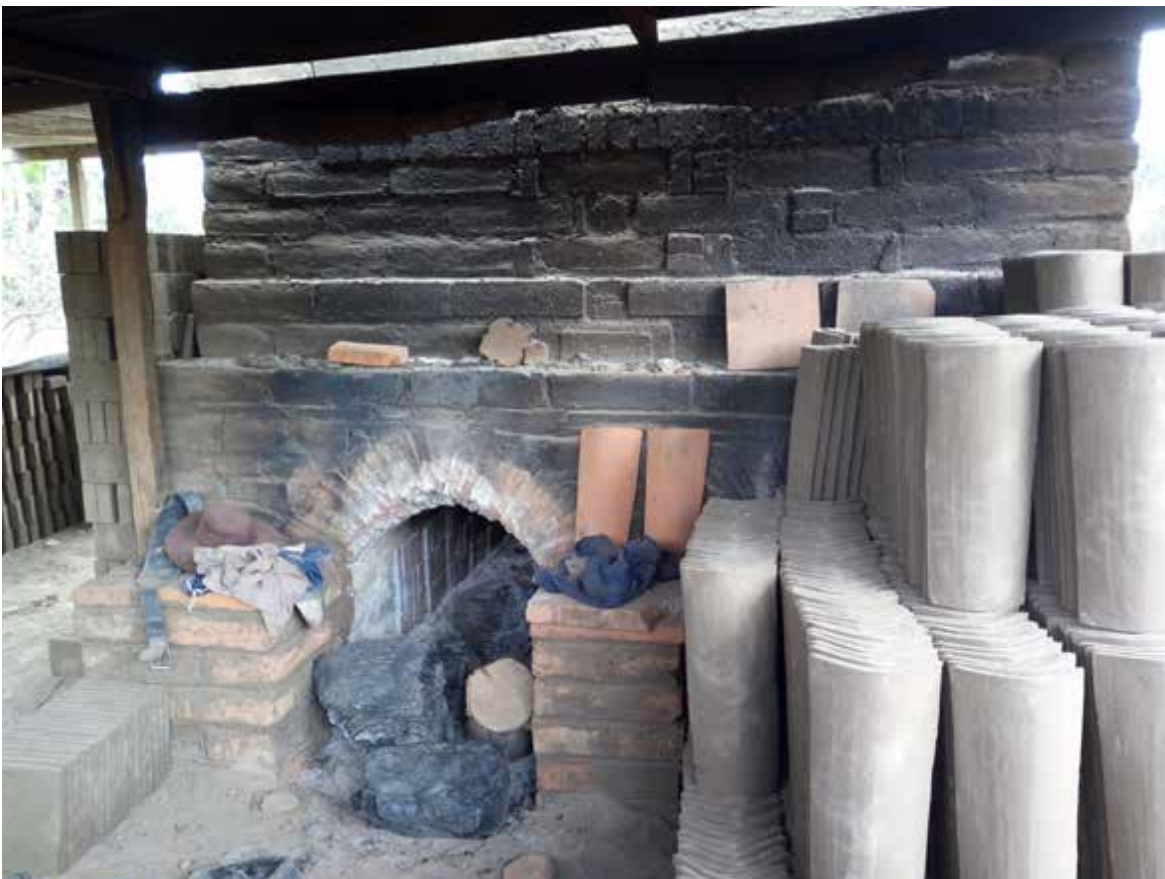
Figura 2. Galera de la ladrillera El Alfarero.