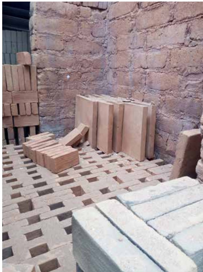
Figura 7. Cargando el horno en la ladrillera de Miguel Ángel Santos.

Para cargar el horno, el material a cocer se deposita de forma entrecruzada, para dejar que el calor llegue hasta las piezas situadas más arriba. Por lo general, los ladrillos se sitúan en la parte inferior, mientras las tejas, por ser más delicadas, se colocan en la parte superior.