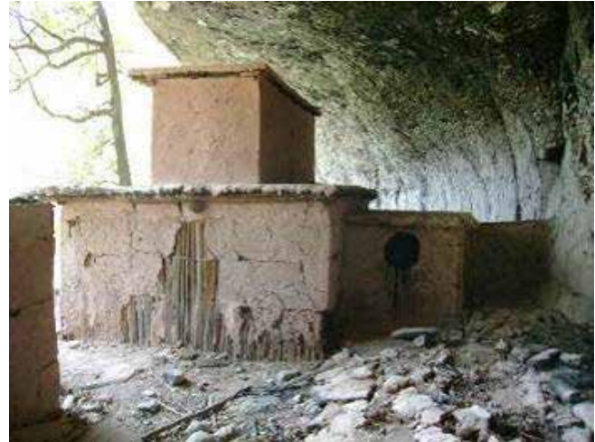
Figura 4. Viviendas prehispánicas de dos niveles, realizadas con secciones de madera, colocadas verticalmente y sujetadas con travesaños atados. Ese entramado se recubría con tierra arcillosa. Cueva del Maguey, Durango.

Cuando la tierra utilizada era demasiado plástica, como consecuencia de la cantidad o tipos de arcilla contenidas, requirió ser estabilizada mediante el