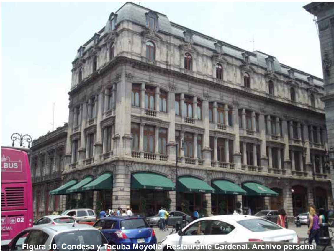
Figura 10. Condesa y Tacuba Moyotla Restaurante Cardenal.