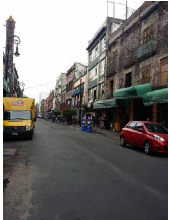
Figura 8. El comercio ambulante daña el patrimonio.

Es constante la palabra deterioro y abandono seguido por la palabra regeneración, aprovechamiento, y en otros casos repoblamiento. Por lo tanto, se identifica un imaginario colectivo