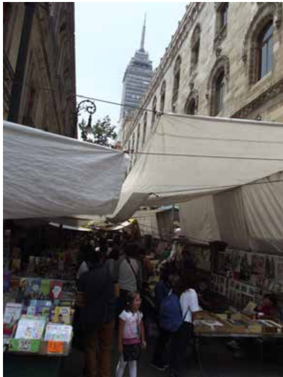
Figura 7. Callejón Condessa Moyotla Comercio ambulante.

pueden integrar en talleres participativos a futuro, en esta investigación las mismas presentan similitud en todos los casos, donde en ningún momento se menciona nada sobre la ciudad estética y bella, sin embargo en general, en el discurso de los actores se identifica una sociedad desigual y asimétrica contenida en dicho espacio, lo que introduce rutas analíticas para la reflexión en donde la preocupación por la equidad es predominante en todos los discursos y consecuencia misma es la estética del lugar puesto que la sociedad es el espíritu de lo urbano y lo estético y su conjunción con la forma conforma una avenencia del objeto estético.