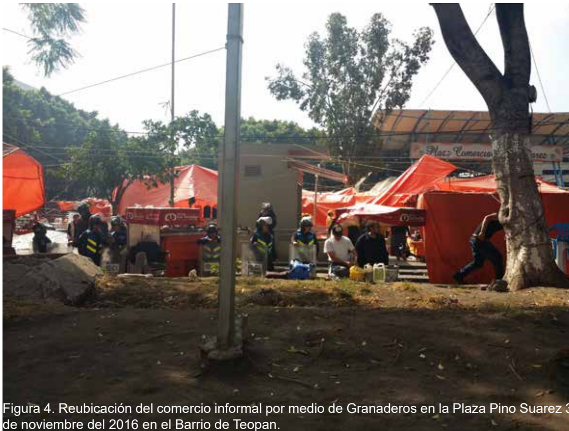
Figura 4. Reubicación del comercio informal por medio de Granaderos en la Plaza Pino Suarez 3 de noviembre del 2016 en el Barrio de Teopan.