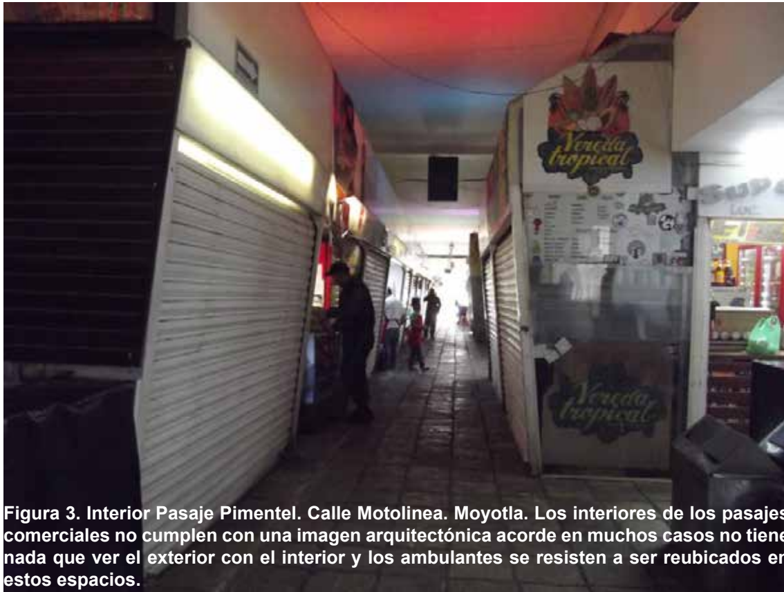
Figura 3. Interior Pasaje Pimentel. Calle Motolinea. Moyotla. Los interiores de los pasajes comerciales no cumplen con una imagen arquitectónica acorde en muchos casos no tiene nada que ver el exterior con el interior y los ambulantes se resisten a ser reubicados en estos espacios.