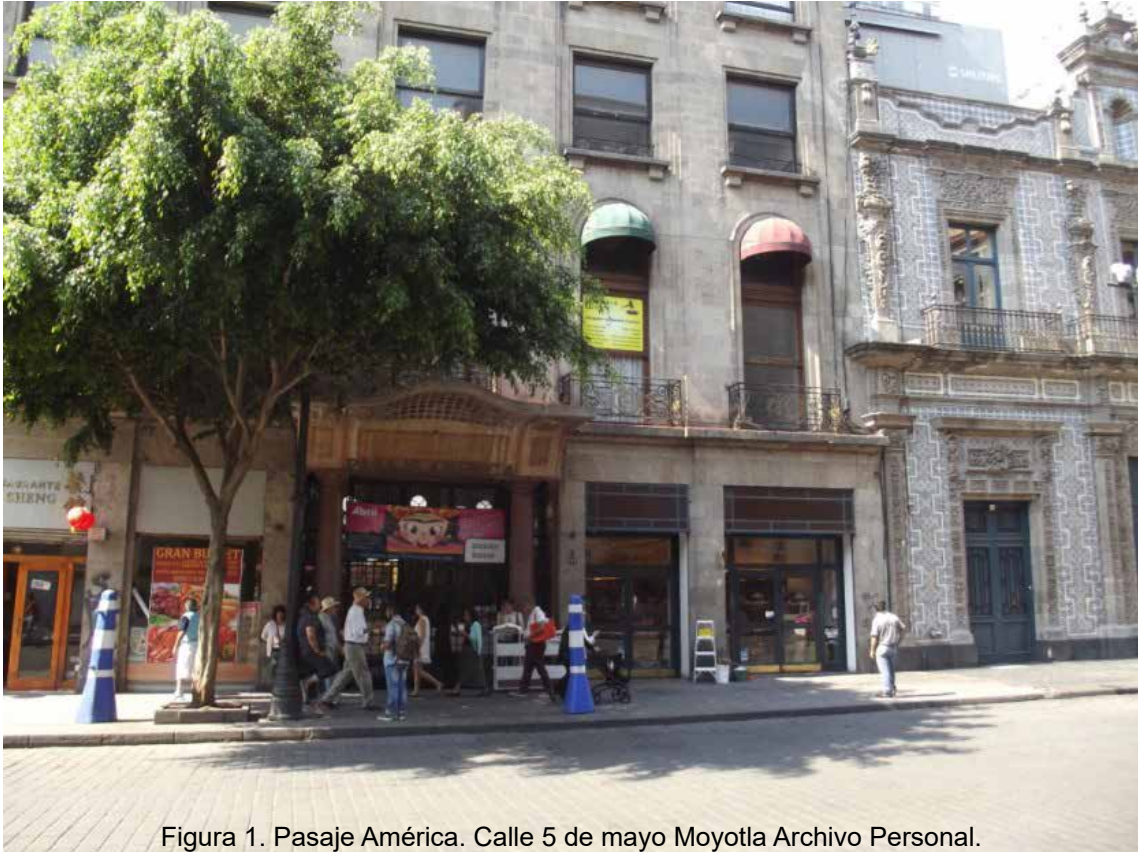
Figura 1. Pasaje América. Calle 5 de mayo Moyotla Archivo Personal.