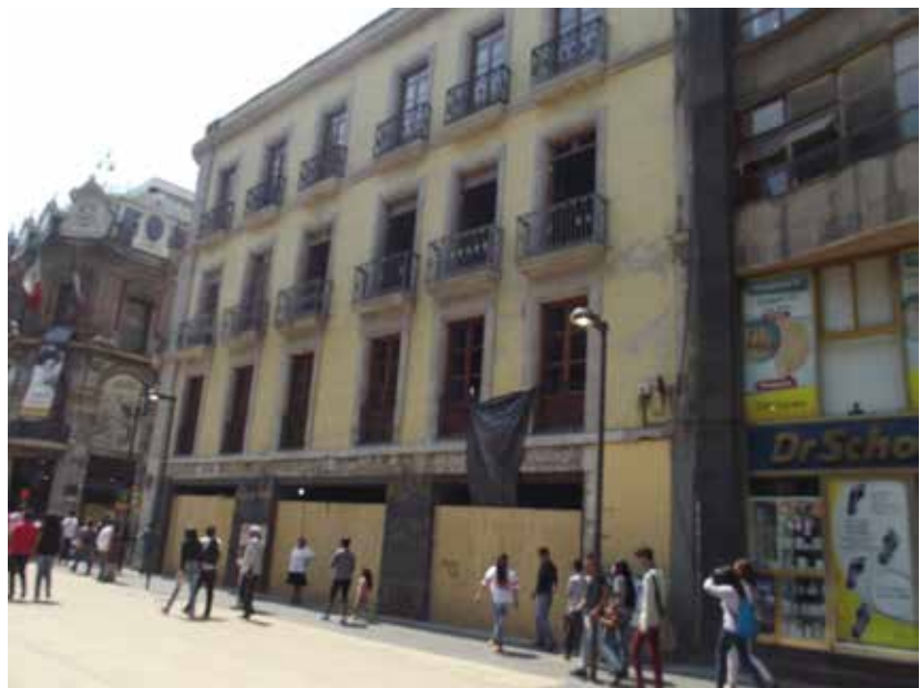
Figura 6. Madero e Isabel La Católica Moyotla.