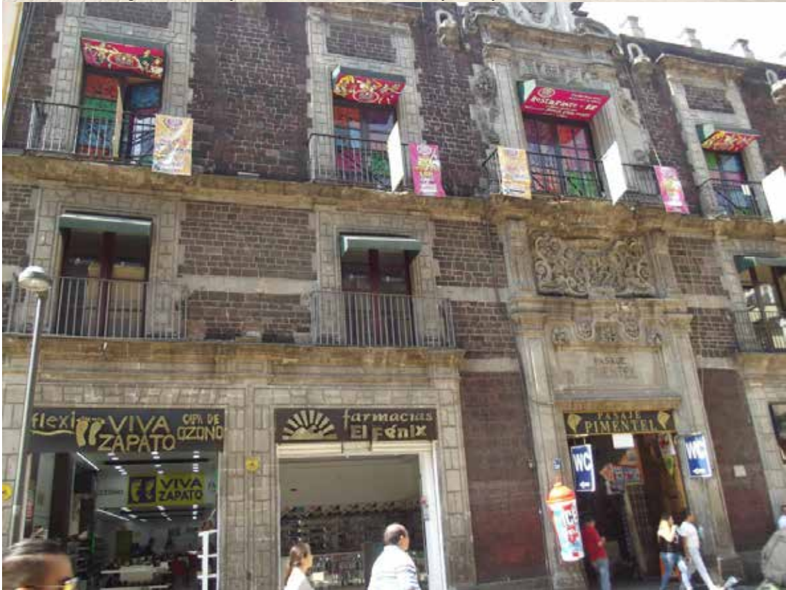
Figura 2. Pasaje Pimentel. Calle Motolina. Barrio Moyotla.