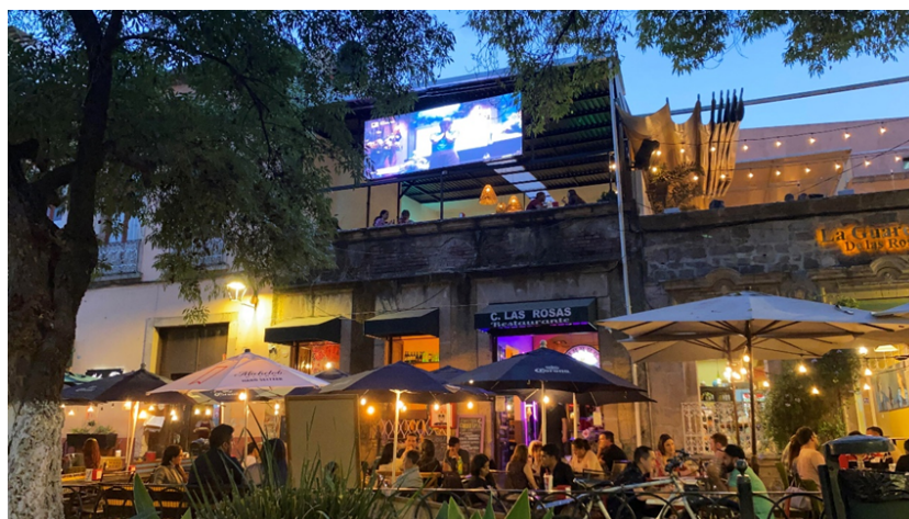
Figura 5. Centro Histórico de Morelia. Impacto de actividades turísticas en el paisaje urbano histórico.

Por su parte, Dai et al. (2022) observan que “la designación de Patrimonio Mundial de la UNESCO se ha convertido en una etiqueta internacional que da a conocer la gran importancia y los valores de los bienes patrimoniales en todo el mundo [...] y también a una reputación competitiva en el desarrollo del turismo” (p. 1131). Haciendo referencia a ciudades europeas en la LPM como Venecia, Praga, Ámsterdam, Barcelona y Lisboa, Troitiño (2018) señala que “la sobrecarga, masificación y los excesos del turismo son un peligro real para la conservación y para la vida urbana [que] puede conducir a que la marca UNESCO, hoy con indiscutible prestigio, se pueda convertir en