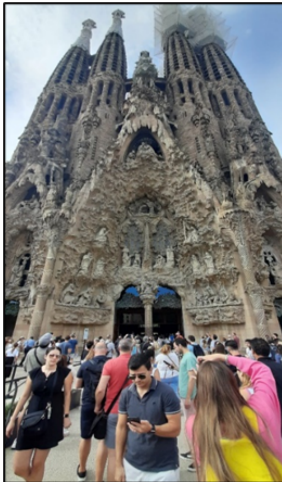
Figura 2. Sobrecarga de visitantes (Overtourism) en la Catedral de la Sagrada Familia, Barcelona.