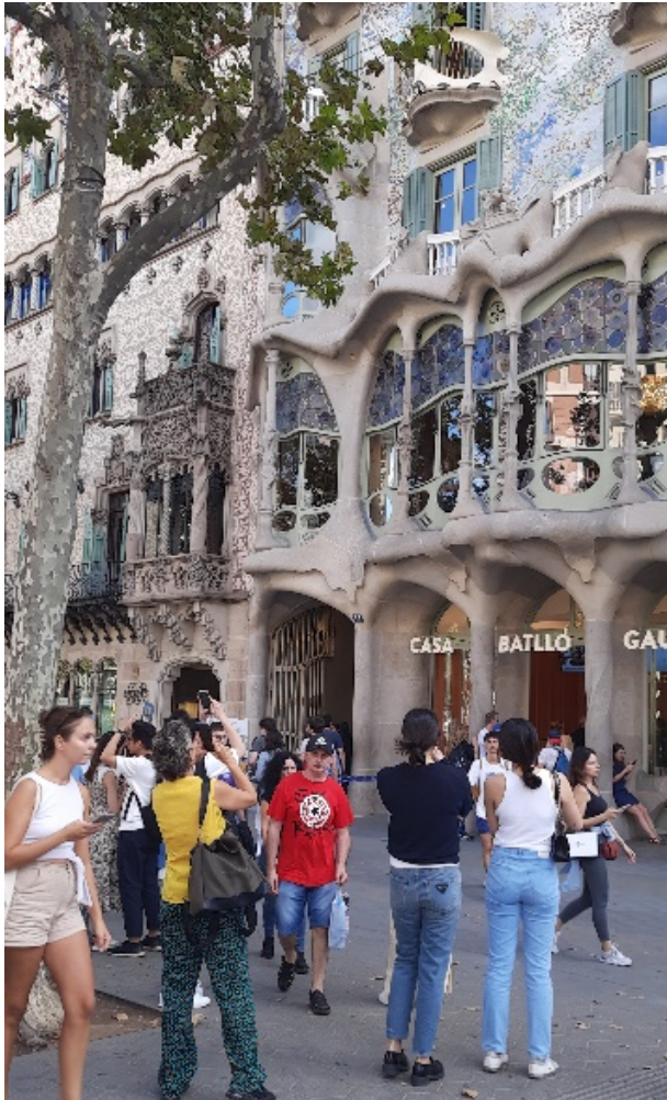
Figura 3. Casa Batlló, Paseo de Gracia, Barcelona.

Este trabajo tiene como objeto de estudio el debate científico y el marco teórico acerca de la conceptualización de la gestión turística del patrimonio cultural cimentada desde la década de 1960 por el ICOMOS. Frente a los paradigmas científicos (Guadilla, 1995) que prevalecen actualmente sobre el turismo cultural, se aborda la discusión reciente y los planteamientos de la Carta Internacional sobre el Turismo Cultural Patrimonial (ICOMOS, 2022), valorando la importancia de su aplicación para hacer frente a los problemas no atendidos y los retos en un escenario de gestión postCOVID-19. A partir de esto, se analizarán tanto la evolución conceptual, los principios y directrices doctrinales, así como el cambio de visión sobre la gestión y los impactos del turismo cultural en los sitios patrimoniales y ciudades históricas.