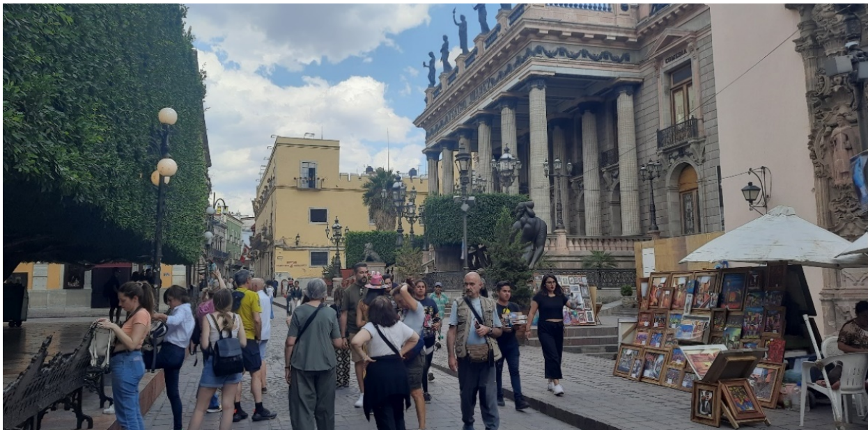
Figura 4. Gentrificación turística en el Centro Histórico de Guanajuato, México.

vía para generar un vínculo entre las personas y los bienes visitados” (Sánchez-Clemente, 2022, p. 263). Además, mejora la calidad de vida de la población anfitriona; permite recuperar el patrimonio arquitectónico y difundir ampliamente la gastronomía, las ciudades patrimoniales, y las poblaciones rurales con paisajes, tradiciones y un carácter histórico excepcional.