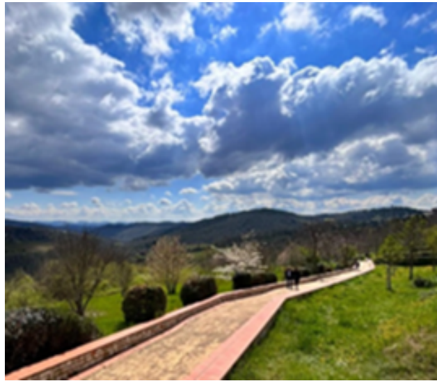
Figura 7. El patrimonio como un recurso irremplazable. Paisaje cultural en la Región de La Toscana, Italia.

recurso irremplazable que debe transmitirse a las generaciones futuras (Figura 7).