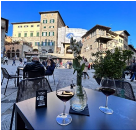
Figura 6. Promover experiencias satisfactorias para locales y visitantes. Cortona, Italia. Turismo enológico en la Región de Chianti, Italia.