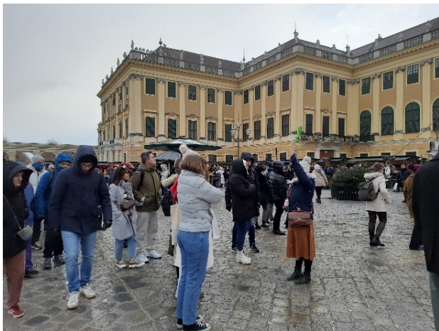
FigFigura 10. Saturación turística en el Palacio de Schönbrunn, Viena, Austria. Fuente: créditos propios, noviembre 2023.

Para concluir, en las cartas se propone una serie de principios que se amplían en sus nuevas ediciones, en especial la de la Carta de 2022. Se reiteran, como prioridad, la protección y uso ético del patrimonio cultural, la adecuada gestión del turismo, concienciar y sensibilizar al público, reforzar los derechos de las comunidades, e incluir medidas de sostenibilidad climática y ecológica. Ahora, el nuevo reto será incentivar el que se asuman los actores públicos y privados, así como monitorear y evaluar si se incluyen en los procesos de gobernanza patrimonial y turística.