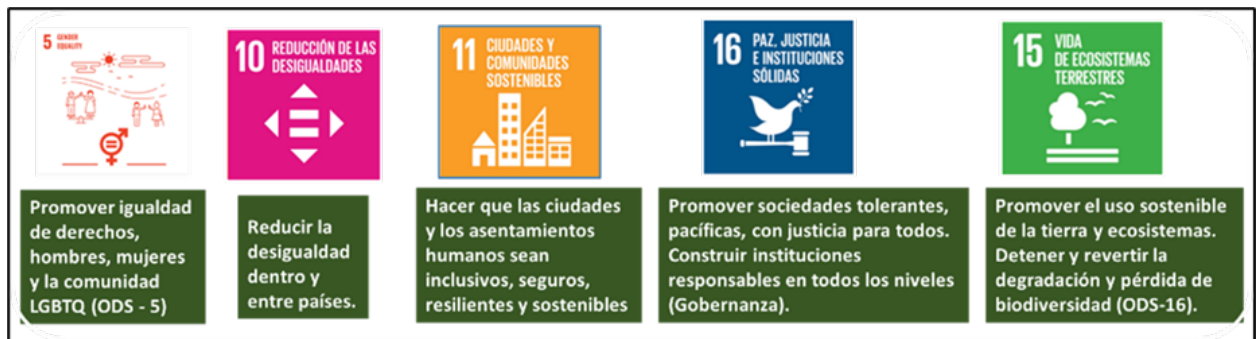
Figura 8. Vinculación con los ODS para la sostenibilidad de la sociedad, del patrimonio y del turismo.

Estos puntos se dirigen a una sensibilización en la conceptualización del tratamiento del patrimonio cultural mediante la gestión del turismo, para evitar la masificación y explotación comercial de los destinos, y fomentar la distribución equitativa e inclusiva del turismo. La Carta de 2022 manifiesta conceptos nuevos: identidad cultural de las comunidades anfitrionas, colectividades indígenas y de los intereses, expectativas, y comportamiento ético de los visitantes. El mensaje se orienta a la participación de la comunidad en la planificación del turismo con el fin de establecer indicadores vanguardistas para enfrentar los impactos del turismo en el patrimonio cultural y las ciudades históricas. El discurso, ahora, cumple con la vinculación con los Objetivos de Desarrollo Sostenible (ODS) para el desarrollo social a través del patrimonio y del turismo (Figura 8).