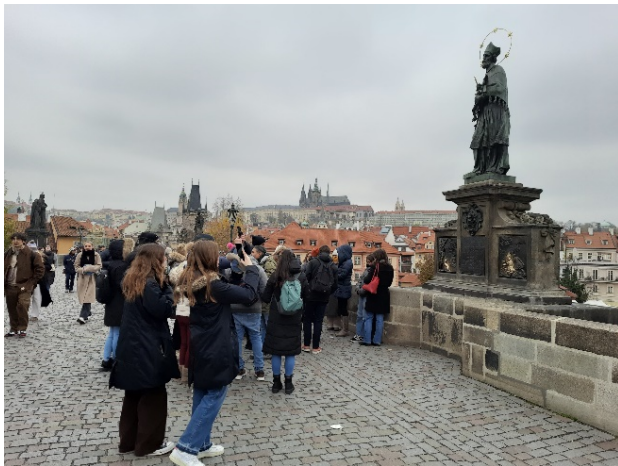
Figura 9. Puente de Carlos IV, Praga República Checa.

los entornos naturales y sitios históricos. Sin embargo, los escenarios recientes (2023) muestran pocos cambios en los procesos de desarrollo de los destinos turísticos patrimoniales (Figuras 9 y 10). En este contexto, la Carta de 2022 señala un camino a seguir en los próximos años, a fin de procurar construir un modelo de planificación y manejo más responsable, ético, sostenible y menos destructivo. Sus principios reiteran, como prioridad, la protección y uso ético del patrimonio cultural, la adecuada gestión del turismo, concienciar y sensibilizar al público, reforzar los derechos de las comunidades, y el incluir medidas de sostenibilidad climática y ecológica. Ahora, el nuevo reto será incentivar a que se asuman los actores públicos y privados, así como monitorear y evaluar que se incluyan en los procesos de gobernanza patrimonial y turística.