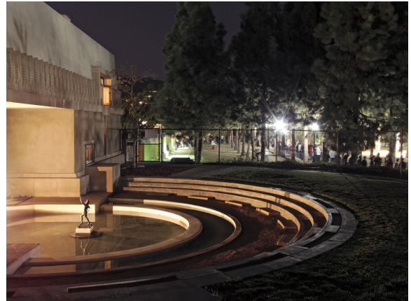
Imagen 11: Hollyhock House, Fuente: Junkyardsparkle - Own work, CC BY-SA 4.0, https://commons.wikimedia.org/w/index.php?curid=38415736

La descripción del entorno para Mijares es ya la descripción de la arquitectura, porque un arquitecto lee y habla de los espacios arquitectónicos a partir de su entorno; por esto describe la sonoridad de la selva, “intensa, envolvente y variada”, el canto de las aves, el grito de los monos, el sonido de la lluvia, del viento, los “sonidos sensuales profundos, agudos, persistentes”; lo mismo sus aromas y olores, la tierra mojada, las flores, los frutos, algún animal muerto, la mirada de la percepción del relieve, del detalle, de la confusión, los colores, el barro, los intensos verdes de la vegetación. La sensación del calor, de la humedad, el frescor de la sombra, la intensidad del sol. Es esta sensación de encierro y de cobertura de la selva la que le da una mayor fuerza a Tikal, que se erige como una obra que conquista el espacio.