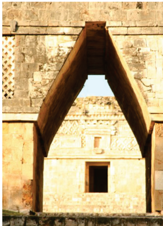
Imagen 3.: Arco del Cuadrángulo de las Monjas de Uxmal “Es el ejemplo más claro de transición entre un espacio público y abierto a un espacio acotado y más privado”, Gilabert: p. 57.

El lenguaje arquitectónico maya trascendió las fronteras de su espacio y su tiempo, y fue apreciado por arquitectos del mundo entero. Se convirtió en fuente de inspiración para arquitectos de la talla de Frank Lloyd Wright o de Jon Utzon. Cada uno de ellos supo