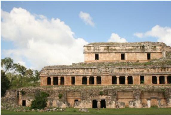
Imagen 7. Gran Palacio de Sayil.

arquitectura prehispánica maya para dos arquitectos, Carlos Mijares y Jorn Utzón, y cómo ella se tradujo en inspiración para la creación de obras arquitectónicas de este último. De esta manera se busca clarificar, a través del ejemplo, cómo un arquitecto percibe la arquitectura y lee los espacios, y cómo esta lectura le lleva a mejorar su diseño arquitectónico.