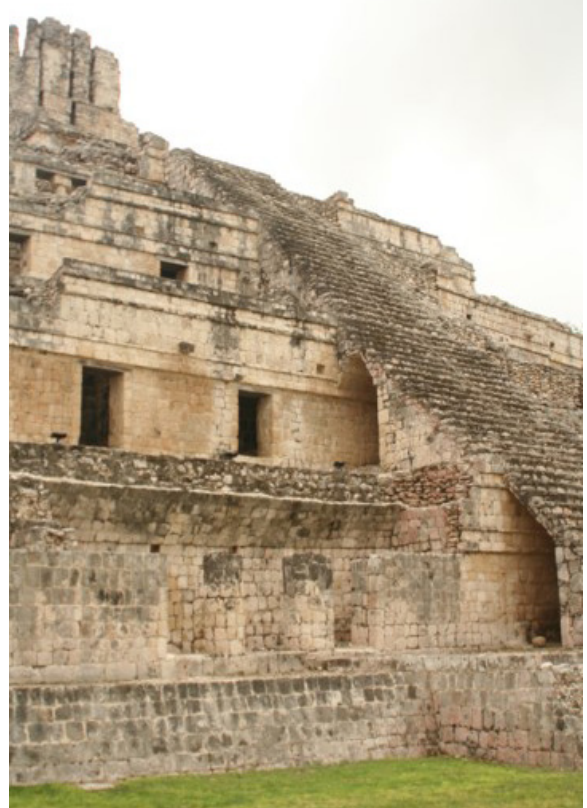
Imágenes 5 y 6: El uso de los arcos dentro de la arquitectura maya permitía dar permeabilidad a sus cuerpos geométricos, tanto como una mayor accesibilidad y circulación, así como proporcionar mayor ligereza al espacio. Arriba se aprecia un arco que penetra las escaleras en Kabah. Ruta Puuk. Abajo, el mismo sentido en Edzná.

leer un lenguaje maya que les inspiró a reinterpretar esta experiencia, y que les permitió generar obras de gran valor estético.