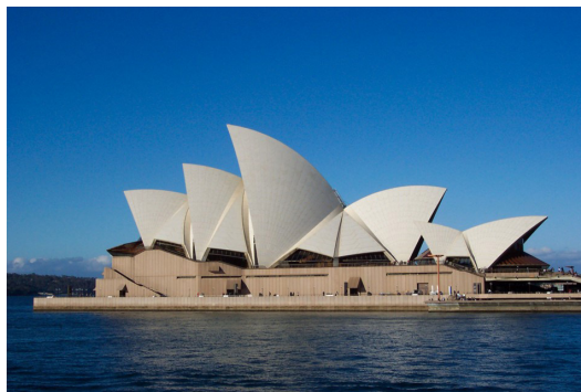
Imagen 13: Opera de Sidney.

“La plataforma, utilizada como elemento arquitectónico, resulta algo fascinante. Me cautivó por primera vez en México, durante un viaje de