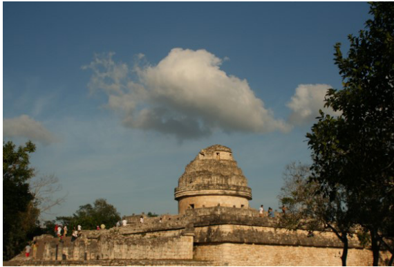
Imagen 9: El Caracol. Observatorio, Fuente. Juan Carlos Mansur.