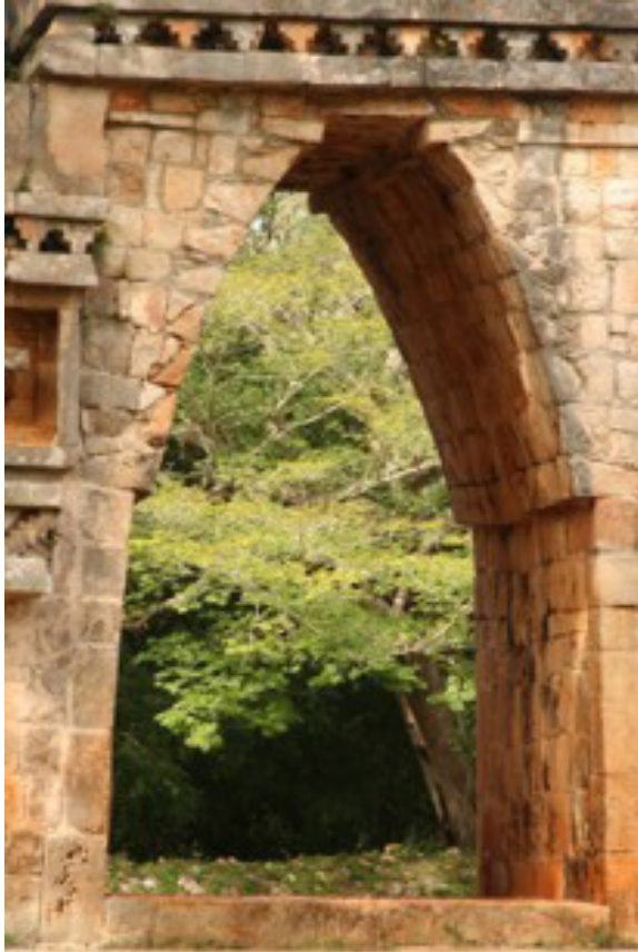
Imagen 4.: El Arco Monumental de Labná. “El arco magnifica el acceso, y constituye un filtro de privacidad entre un espacio público como es la plaza y el patio interior del conjunto, que tiene un carácter más privado. Para acceder se ha de subir a la plataforma del arco, para luego bajar a través de escaleras, enfatizando así el acto de entrar al recinto”. Gilabert: p. 59.