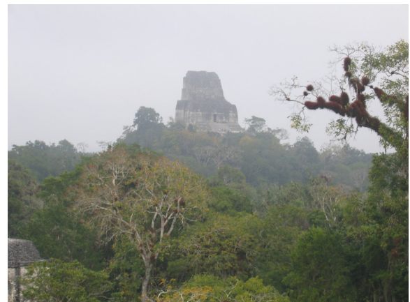
Imagen 12: El entorno selvático, la vegetación, un cielo despejado y libre de contaminación permite enmarcar la arquitectura y comprender su lenguaje. La necesidad de no urbanizar alrededor de estos centros arquitectónicos y respetar su entorno, permite comprender su lenguaje originario y su experiencia de habitar. Tikal.

Sobre esta obra se dice que, sin romper con la selva, los materiales de las pirámides se hallan en armonía con el medio ambiente, porque de ahí salieron, y los mayas los hicieron hablar a través del lenguaje humanizado; de la misma manera, Mijares describe que la arquitectura maya se erigió “respondiendo sabiamente ante las condiciones naturales del clima”, algo que se adolece en la ciudad, donde en contraposición a la edificación maya en unión con la naturaleza, se habitan edificaciones de materiales que ya no encontramos en el entorno, porque el entorno ha desaparecido, se ha urbanizado con el uso del asfalto; se ha desterrado el entorno natural, y los