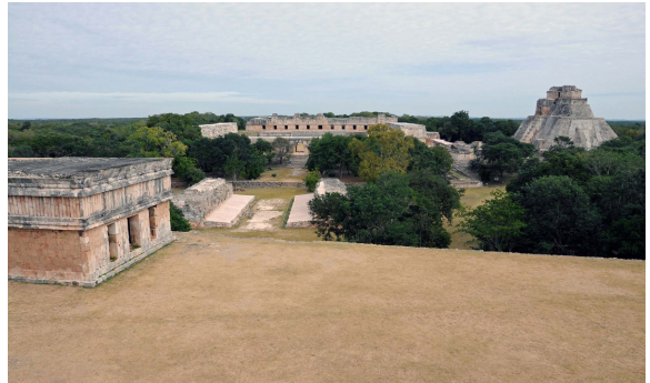
Imagen 14: Uxmal.

“Gran parte de nuestras hermosas plazas europeas se deterioran a causa de los automóviles. Los edificios que antes conversaban entre sí a través de una plaza, ya sea que estuvieran ordenados en sistemas axiales o en composiciones equilibradas, ahora ya no pueden hacerlo porque el flujo del tránsito los separa. La velocidad y el comportamiento sorpresivamente ruidoso de los vehículos nos hacen huir de las plazas, lugares que antes utilizábamos para pasear tranquilamente” (Utzon: 195).