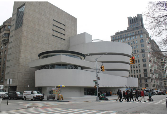
Imagen 10: Guggenheim de Nueva York.

cambio, halla en la naturaleza una forma de vida cotidiana fácil de leer. Es decir, que aprendió a leer el lenguaje de la naturaleza, los ruidos provenientes de los animales, los olores, las nubes.