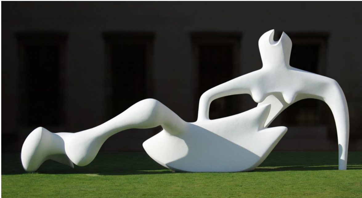
Imagen 1. Figura reclinada, obra de Henry Moore.

algunas obras arquitectónicas de corte internacional, tuvieron como fuente de inspiración la arquitectura prehispánica (Carranza, Luis E: 2021) Esto nos enseña que las obras artísticas del pasado son textos a los que hay que abreviar, para reencontrar en ellos valores que deben ser interpretados y, de este modo, traerlos al presente para dar a la luz valores perennes que trascienden las obras de arte particulares.