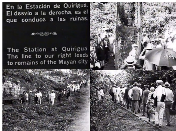
Figura 8. Fotogramas del filme Excursión de la Sociedad de Geografía e Historia a Quiriguá y el Río Dulce en 1927.