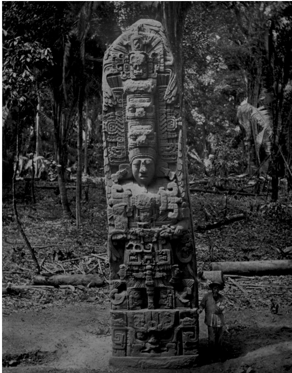
Figura 1. Estela D de Quiriguá. Fotografía de Alfred P Maudslay. 1893

Desde los primeros descubrimientos hasta nuestros días, los métodos empleados para la investigación de las ciudades mayas no han dejado de evolucionar. También así la manera de aproximarse a este patrimonio arquitectónico ha ido modificándose en el transcurso del tiempo, pasando de considerarlo una mera fuente documental a entenderlo como un bien, no sólo con valor propio, sino incluso con capacidad de generar riqueza. Estas perspectivas han influido de manera directa en las estrategias de conservación que se implementaron durante los periodos de excavación arqueológica y, por tanto, en la manera en la que estas ciudades se nos muestran en la actualidad.