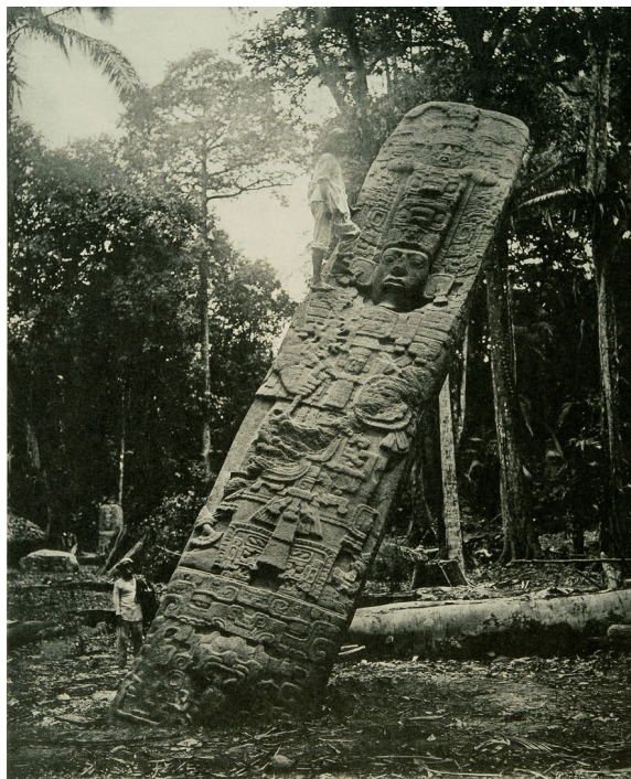
Figura 2. Estela E. Fotografía de Alfred P. Maudslay, 1893.

Posiblemente, el elevado factor de riesgo que amenazaba la integridad de este patrimonio, en peor estado de conservación que el de Copán, según el