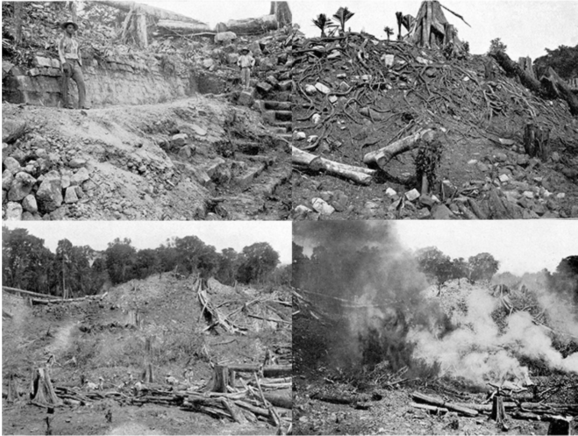
Figura 5. Tareas de limpieza en el edificio 1 de Quiriguá

Introduction to the Study of Maya Hieroglyphs (Morley, 1915).