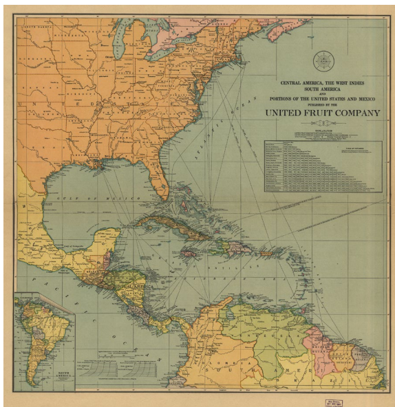
Figura 4. Central America, the West Indies South America and portions of the United States and Mexico. United Fruit Company 1909.