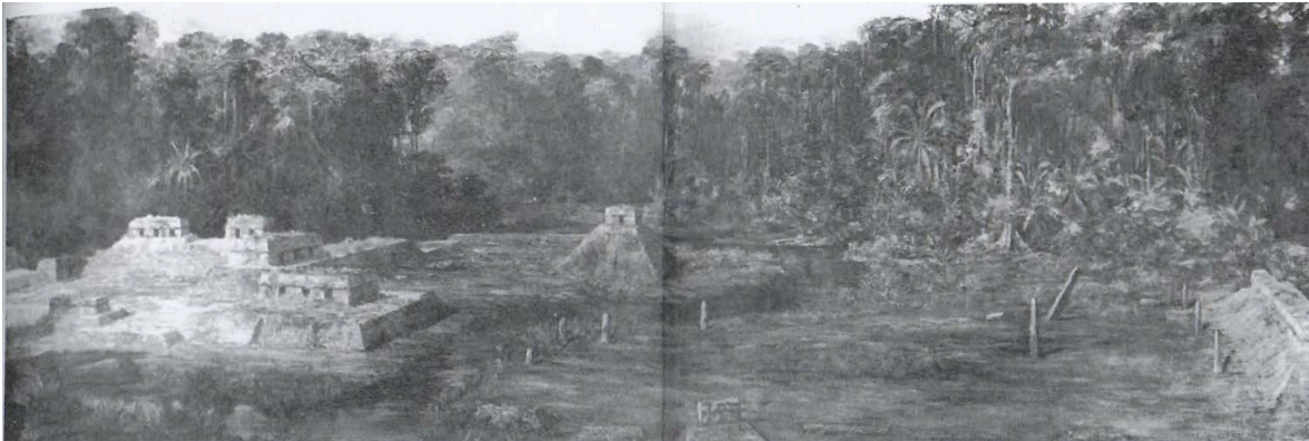
Figura 6. Representación de Quiriguá. Carlos Vierra, 1914. Tomada de Shields (1947, p. 34).