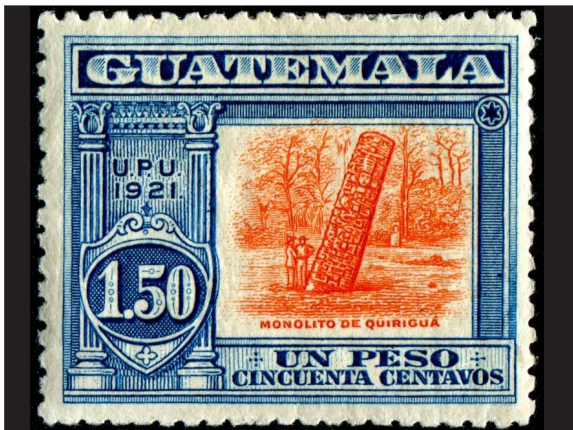
Figura 7. Sellos Unión Postal Universal de Guatemala, con la imagen de los monolitos de Quiriguá. 1921.