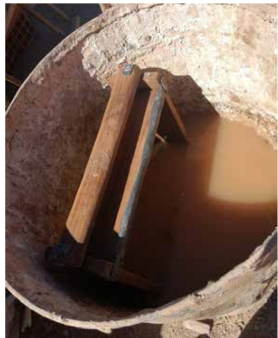
Figura 6. La adobera familiar, en Huichaira.