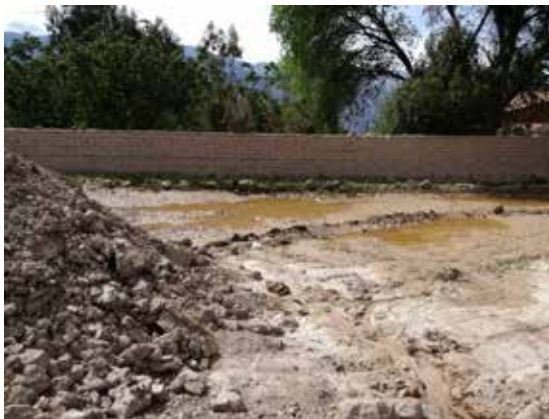
Figura 9. Lugar de preparado del pastón. Juella (Fotografía V. Saiquita).

Más allá de la inclusión de algunas cuestiones aprendidas a lo largo de su vida, durante la práctica innovó en dos temáticas: dejar de usar paja y trabajar con un caballo para mezclar el barro. Para fines de la década de 1950, la paja de trigo para adobes escaseaba, debido a que en Huichaira los pobladores dejaban de producir trigo para empezar a cosechar maíz y duraznos. Frente a este nuevo panorama, al no contar con la paja suficiente y tener que comprarla a terceros, generando gastos extra, decidió suprimirla en sus adobes y depender únicamente del suelo. Para lograr una mezcla óptima sin el agregado de paja, acudió al uso de un caballo, destinando una zona exclusiva en el fondo del terreno (Figura 9). En algún momento, durante el tiempo que vivió en el sur, al acercarse a una ladrillera observó cómo incluir a los caballos para el batido puede acortar los tiempos de mezcla; batir el barro de esta forma no requiere más que la participación de una persona, para guiar el animal y regar el