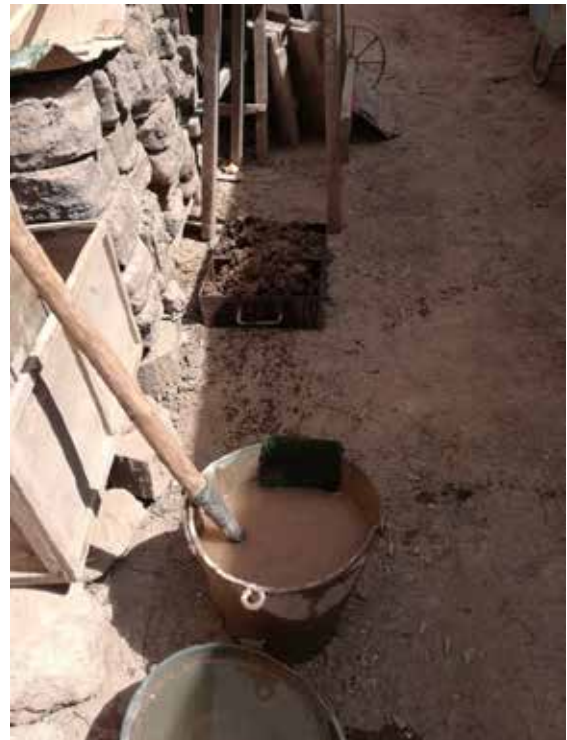
Figura 8. Cortando los adobes.