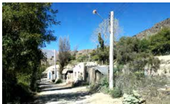
Figura 3. Paraje de Juella, calle principal.