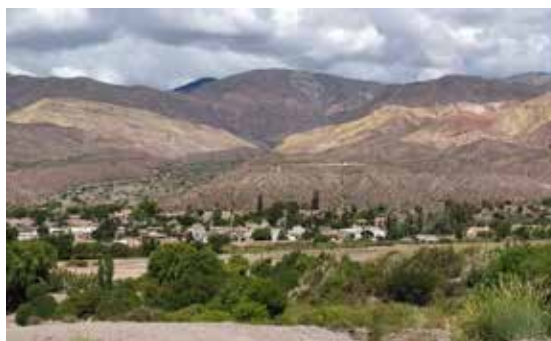
Figura 4. Huacalera, vista pueblo desde Barrio El Molino.

y es, de los tres casos citados, el pueblo más extenso con 2,064 habitantes (DiPEC, 2010).