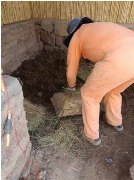
Figura 7. Cortando la paja para el pastón.

En este caso, el intercambio de saberes partió desde lo doméstico, para luego continuar con dinámicas más amplias en una misma comunidad, sumadas a otras experiencias de vida como el trabajo asalariado en otras zonas del país. Para este adobero cortar adobes terminó formando parte de la cotidianidad, donde al elaborar continuamente reafirma aquel aprendizaje de la infancia.