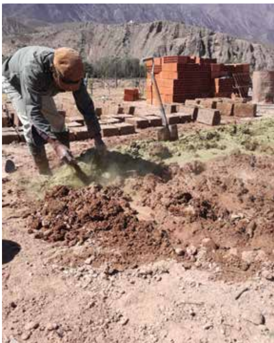
Figura 5. Preparación del pastón con guano, Huichaira.

Una vez dispuestos los materiales, preparaban el barro replicando la forma en la que aprendió de niña. Para el cortado, armaban el molde en madera con dimensiones de 40 x 38 x 11 cm, molde que ella aún conserva (Figura 6).