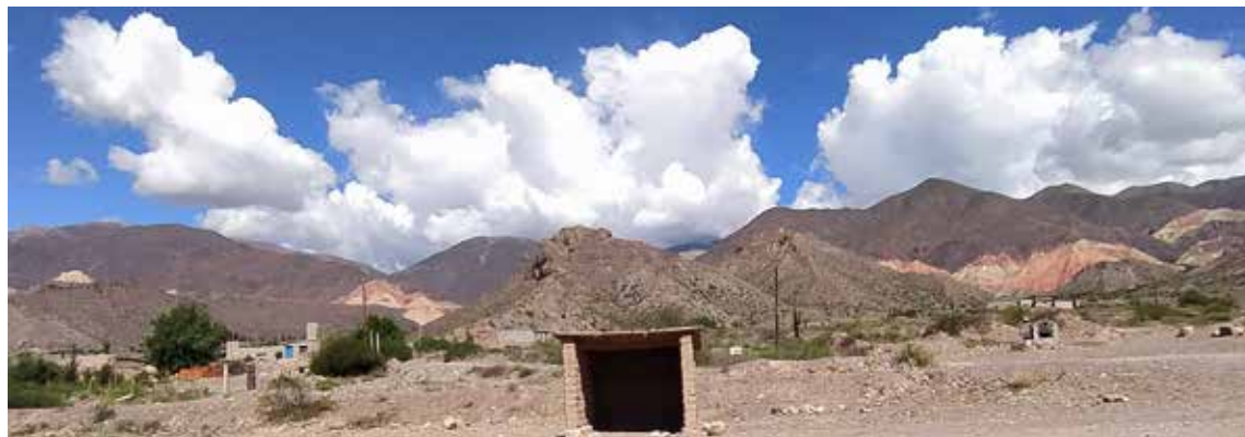
Figura 2. Huichaira, vista del pueblo desde RN 9.