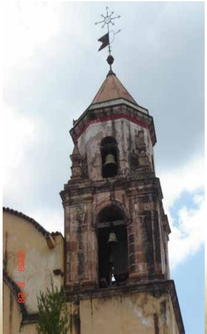
Imagen 4. Torre del Templo de San Ignacio de Loyola.

En el costado poniente del edificio se encuentra la portada lateral por donde se accede desde la calle proveniente de la plaza principal [Imagen 5]. Se asciende primero por una escalinata que compensa el desnivel entre el costado sur y el frente, hasta llegar al vano que cierra en un medio punto de extradós moldurado inscrito entre dos pilastras toscanas sobre un alto pedestal; el entablamento aparece sólo con el molduraje del arquitrabe. La puerta de madera es semejante a la de la portada principal. Arriba de este elemento se abre una ventana rectangular, que sigue el eje central de esta composición; pero ésta, a diferencia de la fachada principal, carece de todo elemento decorativo.