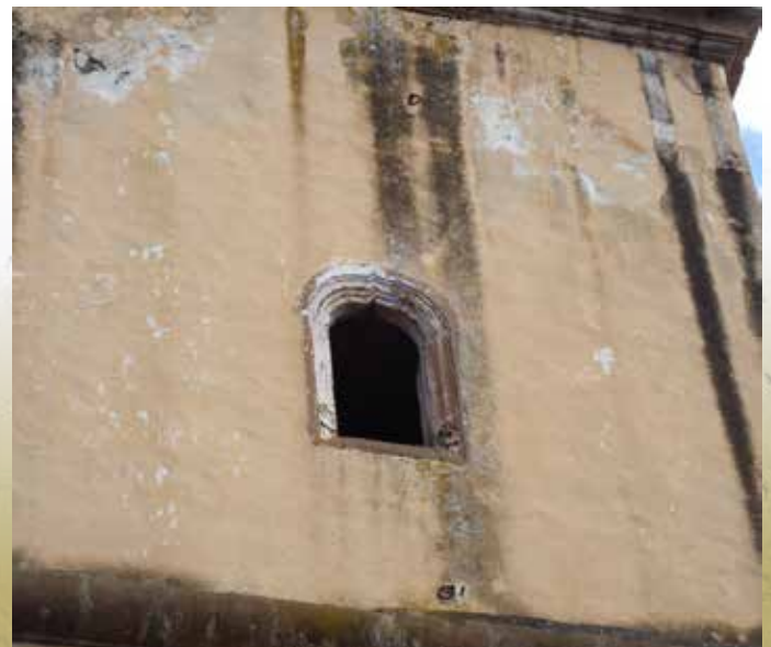
Imagen 3. Detalle del cubo de la torre del Templo de la Compañía de Jesús.

Fotografía: Carlos Alfonso Ledesma Ibarra, 2007