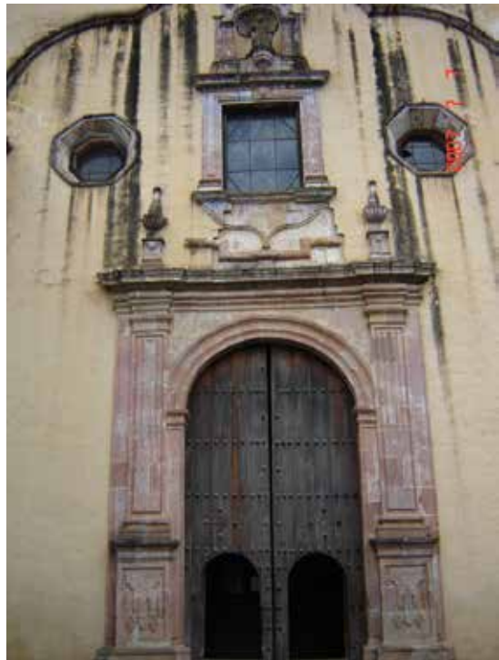
Imagen 2. Detalle de la fachada del Templo de San Ignacio de Loyola.

partes de la fachada. En el cubo de la torre aparecen dos ventanas: una cuadrada y otra pequeña ventana conopial que mira al oriente y revela, por su forma y detalle, la mayor antigüedad de esta parte del conjunto [Imagen 3]. Posiblemente, sólo se hubiesen modificado el remate y los cuerpos de la torre, y no el cubo, en la construcción de finales del siglo XVII. Otra posibilidad, es el rescate de esta ventana que, por su delicada talla, se obtuvo de otra parte del antiguo templo de Vasco de Quiroga (mediados del siglo XVI) o la primera reconstrucción jesuita de 1584.