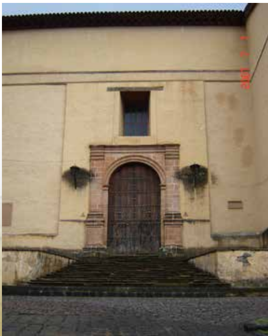
Imagen 5. Portada lateral del Templo de San Ignacio de Loyola.