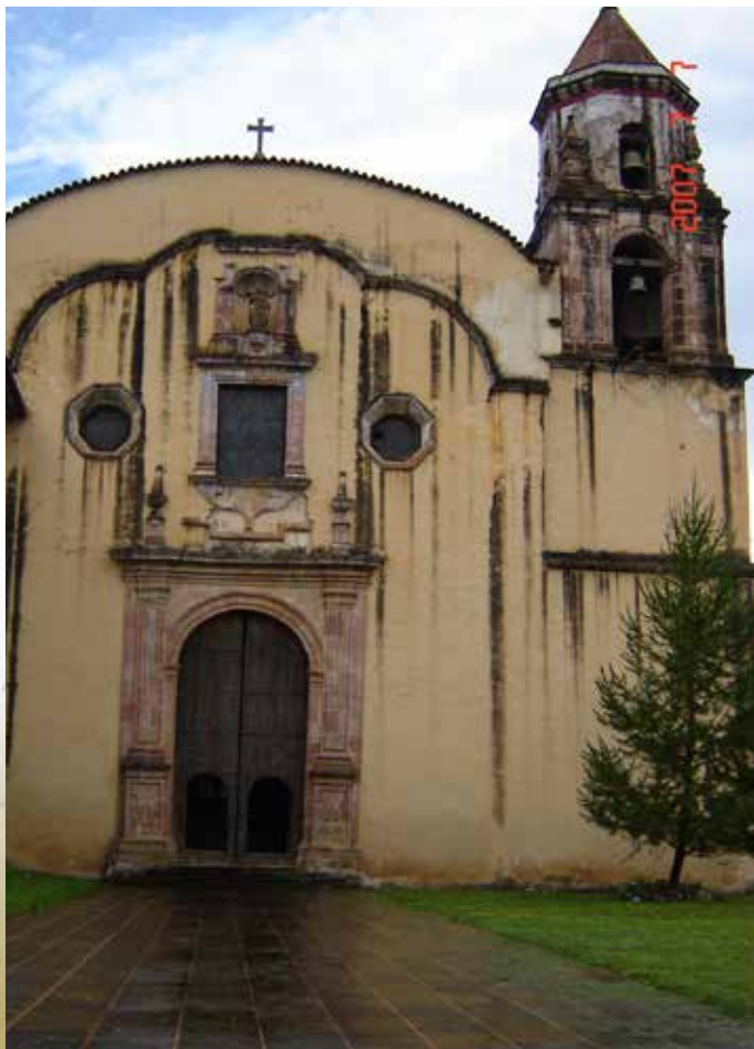
Imagen 1. Fachada del Templo de San Ignacio de Loyola.

Fotografía: Carlos Alfonso Ledesma Ibarra, 2007