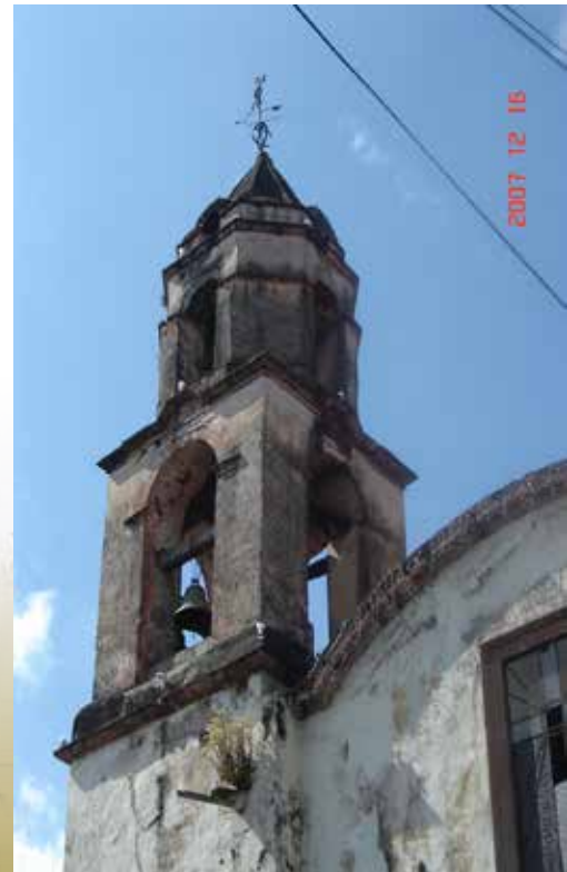
Imagen 9. Torre del Templo de San Juan de Dios.

juanino hicieron a los constructores o benefactores de la obra seguir muy de cerca, en sus elementos constructivos, la torre jesuita. Este elemento reitera la idea y lenguajes en los espacios que se corresponden con el gusto y el discurso visual de Pátzcuaro, y permite vislumbrar la influencia en el trazo y construcción de otros edificios. Curiosamente, el mismo año que se dedicó el templo de los padres ignacianos, 1717, el Templo del Sagrario estaba siendo concluido 34 y estos edificios se encuentran separados apenas por una calle [Imagen 10]. En este recuento no puede excluirse la bóveda de madera del templo ignaciano, pues a pesar de su reciente modificación dicho elemento es recurrente en la arquitectura de la región y, específicamente, en las construidas para la Basílica de Nuestra Señora de la Salud y el Templo del Hospitalito. 35