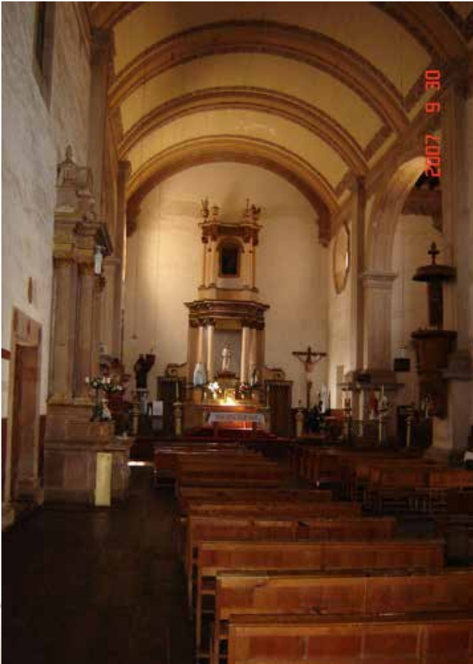
Imagen 7. Vista del presbiterio desde la nave del Templo de San Ignacio.

Más todavía: el método de reflexión ideado por Ignacio de Loyola en sus Ejercicios Espirituales no niega o busca anular los sentidos, por el contrario, se apoyó en ellos para lograr una reflexión y una conversión mucho más sentida y significativa. Por lo tanto, no se desprecia el arte y, en particular, la arquitectura, pues se estima que los espacios propicien las actividades en éstos desarrolladas: educativas o litúrgicas. En otras palabras, todo indica que la importancia de la arquitectura reside en lograr los fines y no se da tanto énfasis en los medios para alcanzarlos; por lo