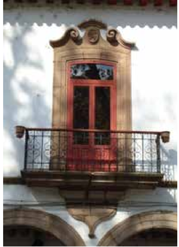
Imagen 11. Guardamalleta similar a la localizada en el Templo de San Ignacio.

El uso de la guardamalleta, antes mencionado, es otro de los elementos recurrentes en la arquitectura de Pátzcuaro. El investigador Gabriel Silva Mandujano localiza y estudia varias de éstas en su texto La casa barroca de Pátzcuaro . Según esta obra, las primeras guardamalletas se caracterizan por su diseño basado, principalmente, en líneas curvas y roleos, enfatizadas al centro por un monograma. Muchas de estas guardamalletas se localizan en las enjutas de los arcos inferiores del portal, o bien en la clave de éstos. En otras ocasiones, la guardamalleta se colocó bajo las cornisas de dintel, como en la casa de Juan Cesáreo del Solar. 36 En el caso del Templo de San Ignacio de Loyola, la ventana coral presenta la guardamalleta más significativa. De acuerdo con la clasificación de dicho autor, ésta debe ubicarse entre las primeras realizadas en la población. La abundancia de este elemento en templos y casas particulares es una constante. Una decoración similar a la guardamalleta observada en el Templo de San Ignacio se localiza en una casa de la plaza principal [Imagen 11]. Otro ejemplo interesante al respecto, se localiza en una casa sobre la Calle de las Alcantarillas, en la cuadra siguiente del colegio, cuyas guardamalletas combinan la forma de la fachada del templo e incluyen una talla similar a la realizada en las pilastras del mismo edificio.