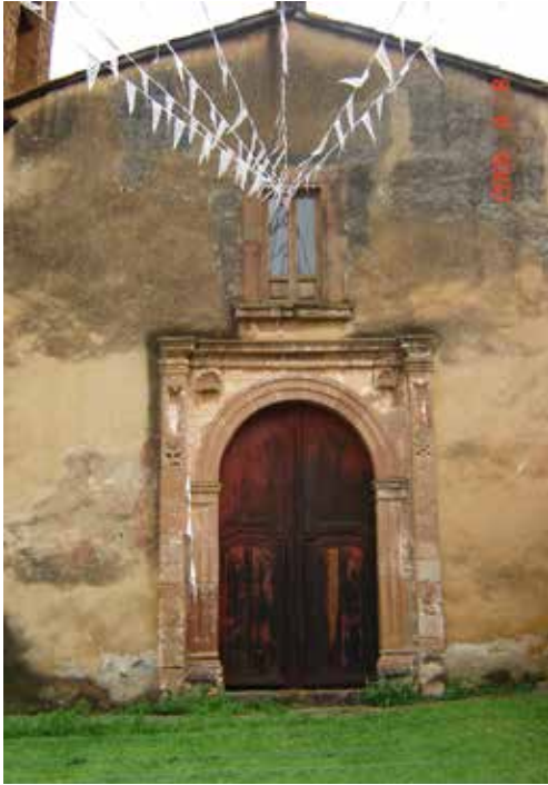
Imagen 12. Portada del Templo del Hospitalito.