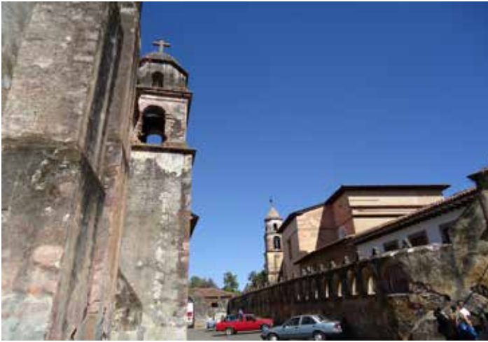
Imagen 10. Vista desde el atrio del Sagrario del Templo de San Ignacio de Loyola.