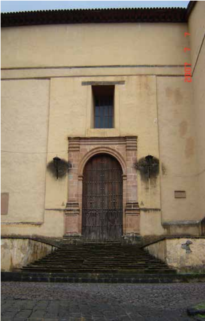
Imagen 5. Fachada lateral del Templo de San Ignacio de Loyola.

La bóveda del Templo de la Compañía en Pátzcuaro es una cubierta de media tijera que dejó atrás la solución de una techumbre de dos aguas y adoptó la bóveda de madera. En consecuencia, se aprecia la “modificación a la fachada con el añadido de muro en la parte alta, para dar cabida a esta bóveda; en el interior del tapanco, es posible observar los cambios sufridos en los espesores de los muros al formar el escalonamiento necesario para descansar el techo abovedado”. 13 Este sistema de bóveda obedece más a una intención formal y decorativa que constructiva, pues la bóveda es un elemento independiente de la cubierta y de los muros, y se aprovecha de estos últimos para apoyarse y su alcance estructural consiste en la capacidad de librar el claro al cual es sometida.