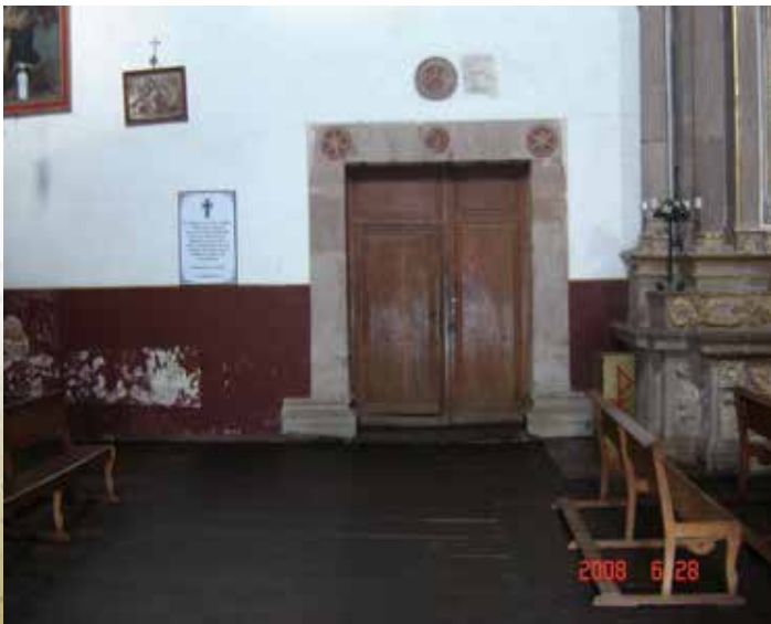
Imagen 6. Entrada a la capilla del Templo de San Ignacio.

El espacio está iluminado por dos ventanas octogonales y una rectangular en el coro y cuatro ventanas rectangulares, dos en el crucero y dos en la nave. La luz se concentra en el presbiterio y en el crucero, quedando el resto del templo poco iluminado. La ventana ubicada frente a la portada lateral, está obturada en sus funciones por una capilla adosada a este costado, la cual permitía la comunicación entre el colegio y el templo. La entrada a la capilla se efectúa a través de una puerta de amplias proporciones y jambas de anchos pedestales; bajo el aplanado se observa la huella de un frontón triangular que remataba la puerta [Imagen 6]. En el dintel aparecen en relieve, tres círculos estrellados y al centro del frontón, un círculo mayor con el anagrama de Jesús y los tres clavos de la pasión (símbolo de la Compañía de Jesús). De esta capilla se ascendía al coro por una escalinata de piedra que también se comunicaba con el colegio.